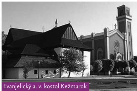
Evanjelický a. v. kostol Kežmarok