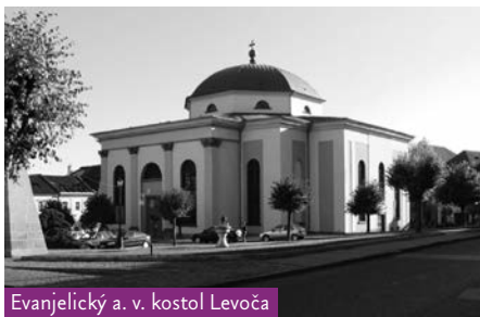
Evanjelický a. v. kostol Levoča