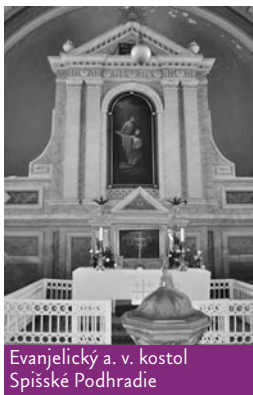
Evanjelický a. v. kostol Spišské Podhradie