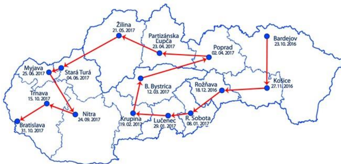
Obr. č. 1: Mapa seniorálnych stretnutí

Jednotiacim prvkom bude odovzdávanie putovnej štandardy medzi seniormi a symbolické pripájanie sa seniorátov i stuhami s vyšitým reformačným textom Písma svätého k odkazu reformácie.