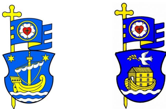
Obr. č. 4: Vzor veľkého erbu seniorátu (RIS, POS)

Pokiaľ má seniorát v zmysle CZ č. 2/2010 o vonkajších symboloch schválený erb seniorátu, potom by za vlajkou ECAV bol do kostola vnesený erb príslušného seniorátu. 8