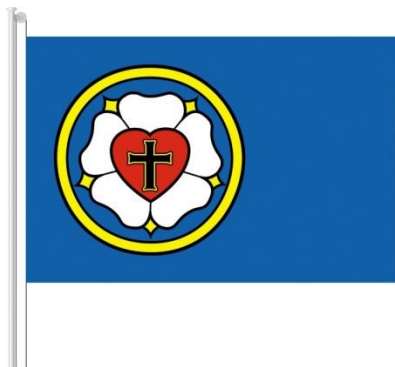
Obr. č. 2: Vlajka ECAV