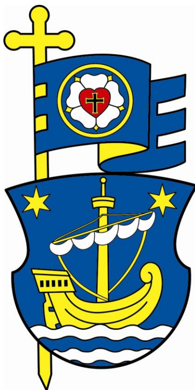
Obr. 3 Veľký erb Rimavského seniorátu

V prípade tzv. veľkého znaku, ktorý predpisuje § 8, odseky 2 a 3 cirkevného zákona č. 2/2010, bude mať Rimavský seniorát horeuvedený erb, nad ktorým bude zobrazená vejúca zástava ECAV ukončená tromi jazykmi.