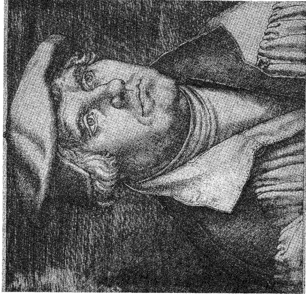
Dr. MARTIN LUTHER